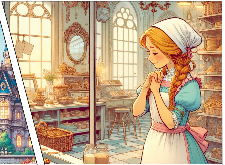
Auf dieser Party gab es feine Guetzli.