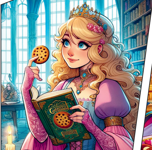
Die Gastgeberin des Schlosses, Prinzessin Wunderbar, hatte eine spezielle Bäckerei im Schloss.