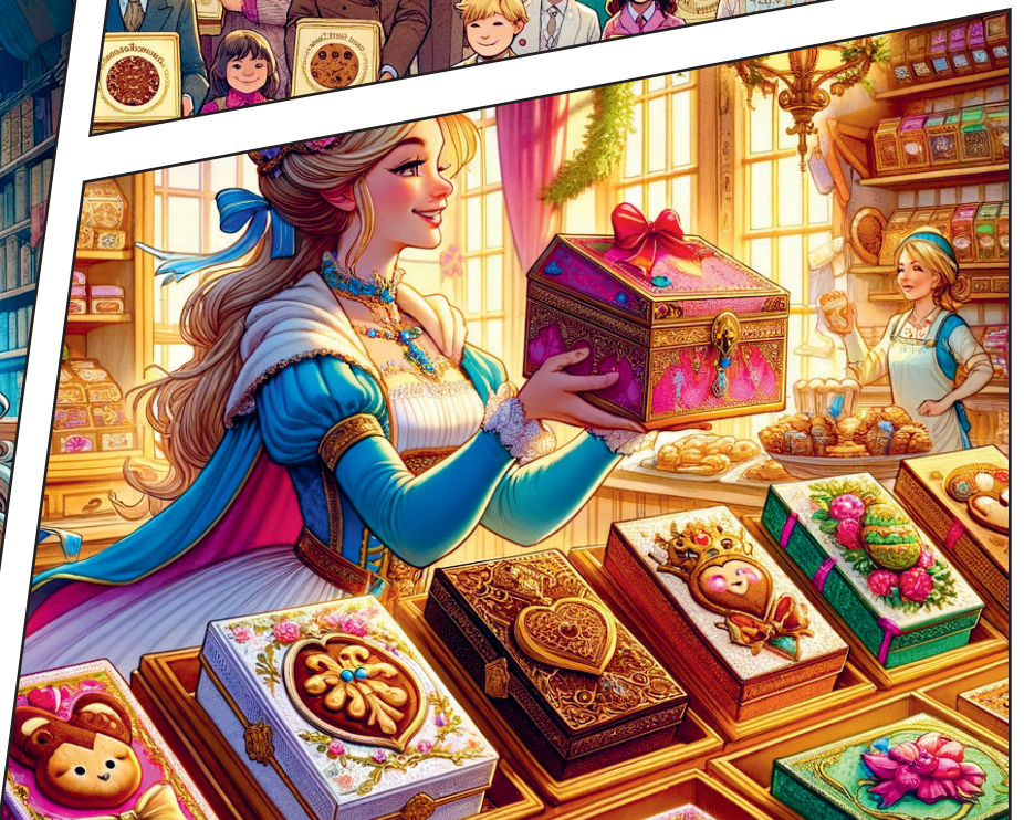
Sie lud ihre Gäste ein, ihre feinen Guetzli direkt aus ihrer Bäckerei zu essen.